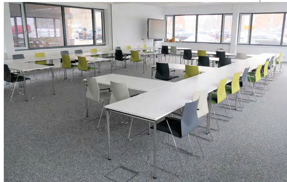
Seminarraum für in- und externe Schulungen